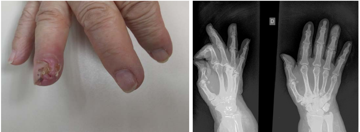
Figura 1. eritema y descamación asociado a tumefacción y a un ligero aumento de la temperatura local. Hemorragias subungueales. Figura 2. Hematoxilina-eosina x4: Carcinoma epidermoide infiltrando hueso